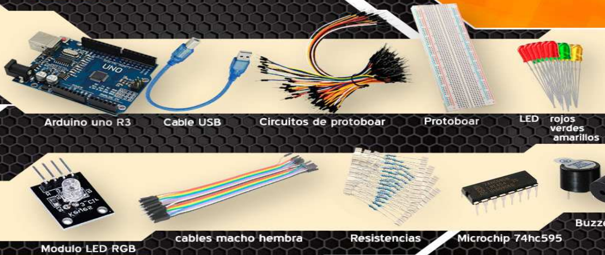
Arduino uno R3